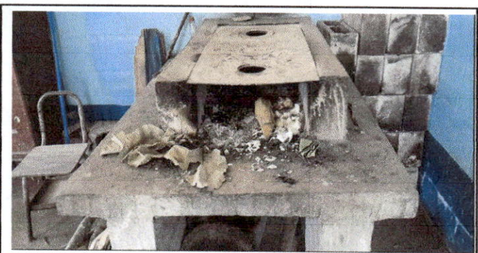
Foto 6: REMOZAMIENTO DE ESTUFA Y HACER OTRO Y UNA MESA DE CONCRETO

Observación: Si es necesario se pueden agregar hojas adicionales y actualizar el número de hojas.